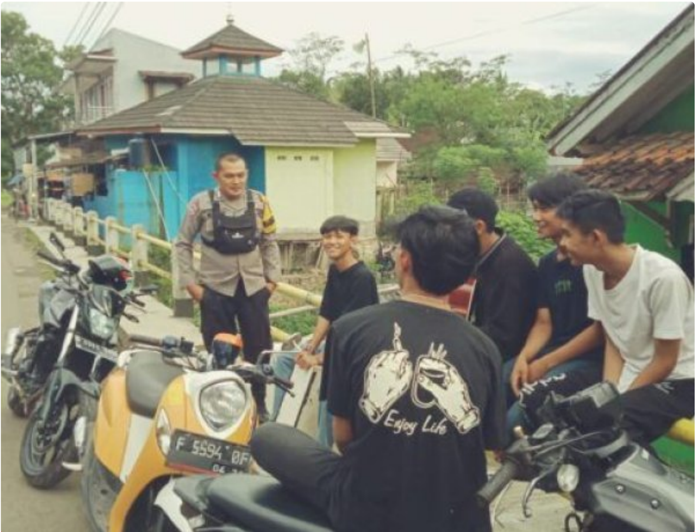
Polsek Cireunghas Polres Sukabumi Kota

Kota Sukabumi – Polres Sukabumi Kota Polda Jawa Barat – Polsek Cireunghas melaksanakan kegiatan dialogis dengan para pengemudi angkutan umum di jalan sempur, Selasa (30/1/24). Kegiatan ini bertujuan untuk menyampaikan himbauan